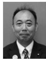
長谷川 泰幸 議員

問1 資源循環を促進するため、「持ち込みスポット」の仕組みをつくり3Rを促進することで、ゴミの減量につなげてはどうか伺う。