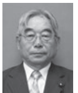
夫 一 藤 後 議 員

問1 2020年より、導入された「外国語」教科について、コロナ禍により様々な制約がある中、担任の補助役である外国指導助手について、