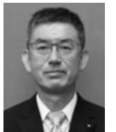
宜 久 林 館 議員

民地における危険木除去費用に対する助成制度は、公益性・公平性・行政関与の必要性等を含め、他の自治体の事例等を参考に調査研究したいと考えています。