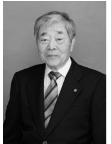
「飯田町長への思い」

昭和46年、私は、当時まだ珍しかったマニフェストで、「70歳以上の老人医療費の無料化」、「可燃ごみの無料収集」、「無駄をなくす清潔な町政」を掲げて初当選して以来、50年間、町の発展のため歩んできました。