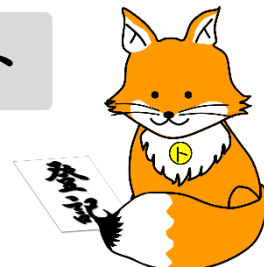
不動産登記推進イメージキャラクター「トウキツネ」

詳しくは『あなたと家族をつなぐ相続登記』で検索、または下記の二次元コードからアクセスしてください。ご不明な点がございましたら岐阜地方法務局美濃加茂支局や、司法書士などにご相談ください。なお、法務省・法務局の名称を不正に使用した勧誘や、架空請求などにご注意ください。