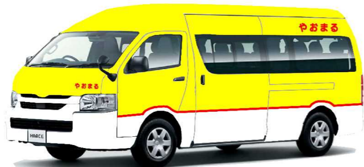
(西部)やおまる 運行車両