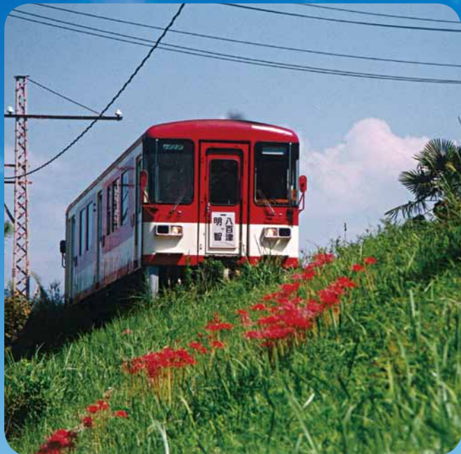
平成13年廃線となった名鉄八百津線