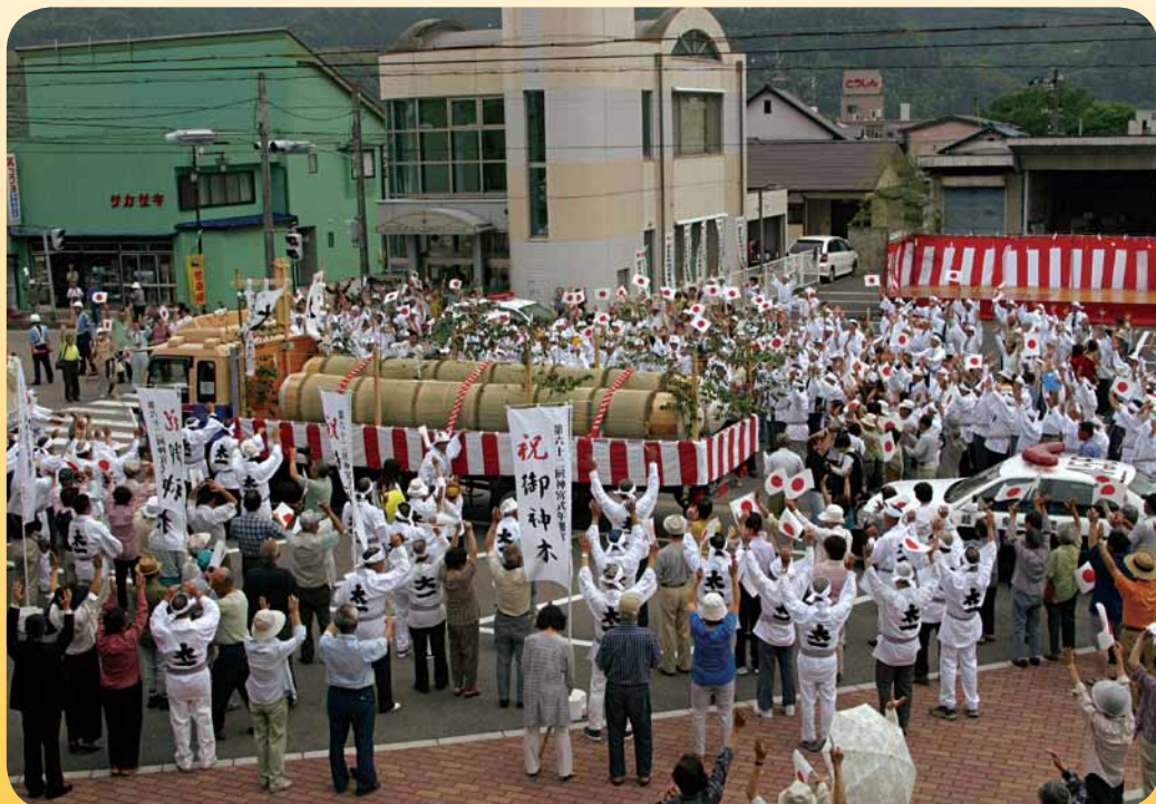
平成17年第62回神宮式年遷宮の用材御樋代木奉迎送式典