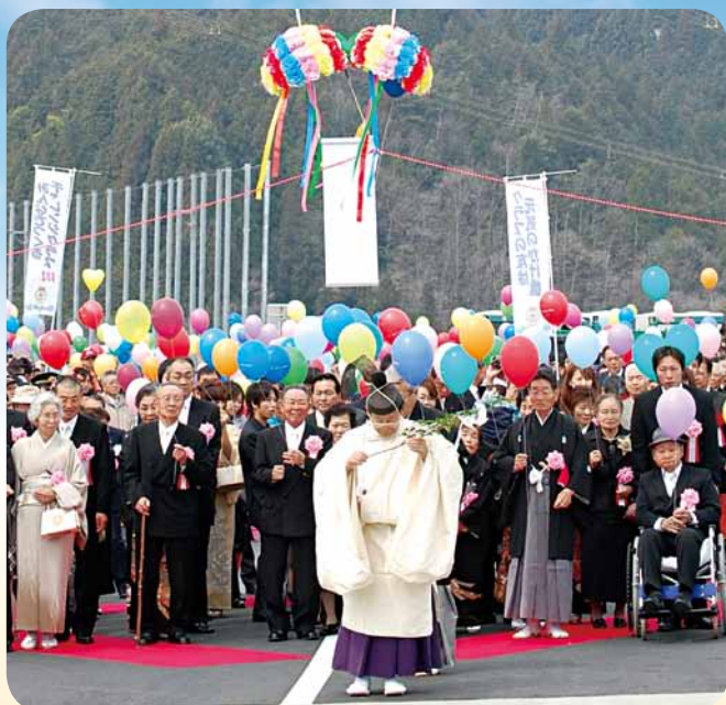
平成22年国道418号線丸山バイパス開通