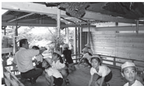
実際にだんじりに上り見学する児童ら

児童らは、お祭り当日はだんじりをじっくりと観察できないため、大きな木製の車輪や藤づるで締め上げた骨組みを熱心に観察し、実際だんじりにも触れたり、巻き尺で大きさを測ったりしました。