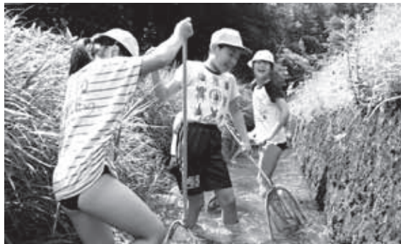
川に住む生き物などを捕まえる児童ら

潮見小学校では今回捕まえた生き物を学校で観察して今後も学習を続けていく予定です。