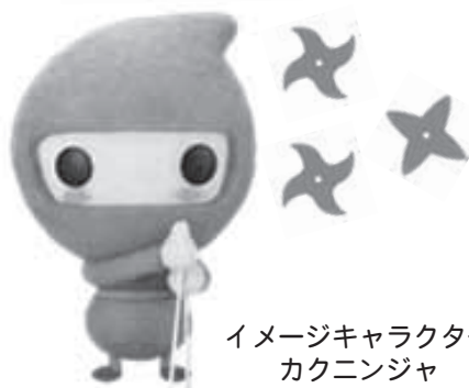
イメージキャラクター カクニンジャ