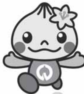
八百津町イメージキャラクター「やおっち」