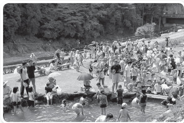
参加者で賑わうフレンドリーパークおおひら

この日は下呂市馬瀬町から仕入れた約2,800匹のマスが木曾川支流の旅足川や公園内の池に放流されると、たくさんの釣り竿が次々とマスを釣り上げ、池では子どもたちがマスをうまく縁に追いつめてはつかみ取りを楽しみました。