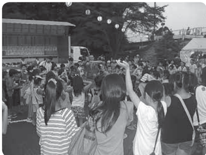
7月28日 錦津 夏まつり

各地区で夏祭りが行われました。地域のみなさんや里帰りをしたみなさんなどに楽しんでもらおうと、夏祭りの役員のみなさんは猛暑の中、汗だくになりながら準備をしました。会場では、懐かしい顔や子どもたちの笑顔などがあふれ、盛り上がっていました。