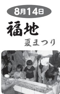
8月14日 福地 夏まつり