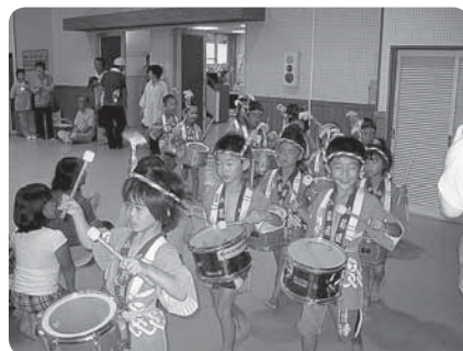
8月18日 和知 夏まつり