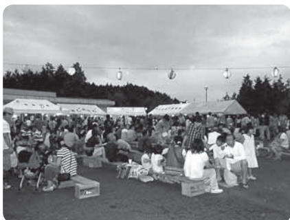
8月14日 潮南 夏まつり