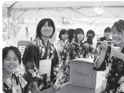
8月14日 久田見 夏まつり