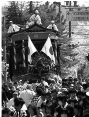
人で山車の車輪が隠れて川を走る船のように見えませんが

八百津祭りは町内を三両の山車が練り歩きます。美しく飾られた3両の山車が引き揃えられると1つの大きな船の形になります。昔、木曾川で材木を運び湊町として栄えた八百津町を象徴した祭りです。