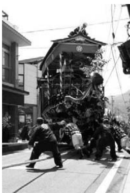
8日の十六銀行前のT字の交差点の様子です。迫力がありますが実際ご覧になるときは誘導員の指示に従ってくださいね。

7日(土)山車が南宮神社前の交差点を勢いよく曲がり、八百津大橋で3両が一つになるところは必見です。8日(日)は八百津町役場前に山車が集まり須賀自治会の神馬を先頭に進みます。十六銀行があるT字の交差点を建物の軒先をかすめながら(時々ぶつかります)勢いよく曲がる場面は本当に迫力があります。