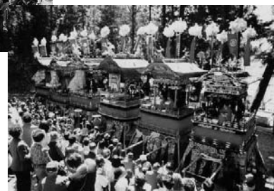
お田見の神明神社で6両が揃い、「糸切りからくり」が披露されます

お田見祭りでは6両の豪華な山車が練り歩き、山車の上の舞台で「糸切りからくり」とよばれる独特の技法で作られた人形劇が披露されますこの「糸切りからくり」は岐阜県の重要無形民俗文化財に指定されているんです。