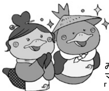
みのかも定住自立圏 マスコットキャラクター 「かも美」と「かも丸」

「みのかも定住自立圏」で検索するか、八百津町・美濃加茂市のホームページから左記のパナーをクリックしてください！！