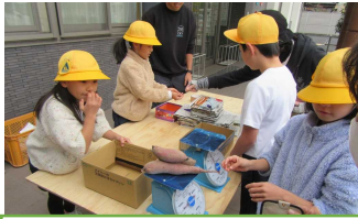
さつま芋の販売の様子

錦津小学校の2年生の児童が、インボックス農園で収穫したさつま芋を青空市で販売しました。生活科と算数との合科の学習でしょうか。はかりを持参し量り売りをしました。来店者に元気に声をかけ、準備した芋をたくさん売ることができました。