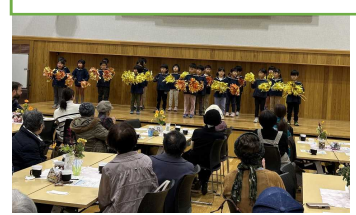
園児(年長さん)による踊り

きらりカフェでは、錦津保育園の年長さんが歌と踊りを披露してくれました。来場の皆さんは、子どもたちが登場ただけで笑顔に。かわいらしい歌と踊りを優しいまなざしでご覧になっていました。その後、錦津小学校4年生が歌を披露してくれ、続いて、来場者の皆さんに木のゲーム(コアス)の遊び方を紹介し、楽しく遊んでいただきました。地域の人と子どもたちがつながれたひと時となりました。地域での活動に理解を示してくださる錦津小の先生方にも感謝です。