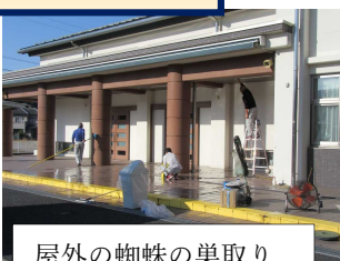
屋外の蜘蛛の巣取り ガラス拭きなど