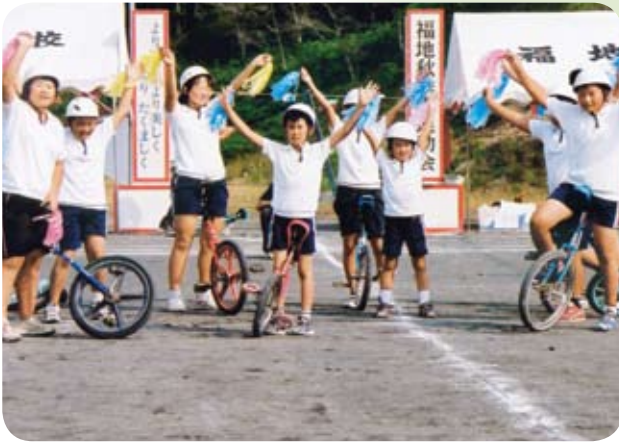
「福地小学校最後の運動会」 市岡英也(第二)