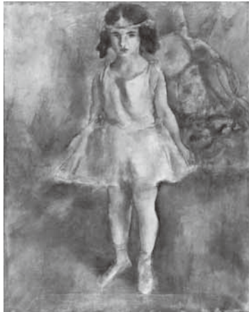
ジュール・パスキン《少女—幼い踊り子》 1924年 パリ市立近代美術館

エコール・ド・パリを代表する画家ジュール・パスキン(1885—1930)。生誕130周年を前に、パリ市立近代美術館や国内のコレクション約100点によりパスキンの画業を振り返ります。