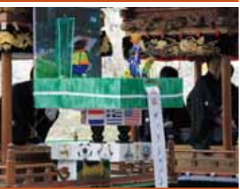
後口・松阪「必勝ザックジャパン」