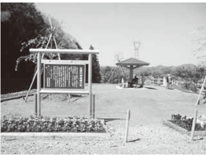
友愛の桜広場と東屋