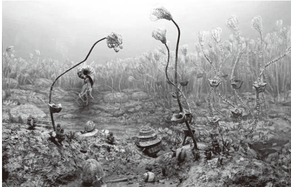
[古生代終わりの海]

県内では、恐竜がいた頃よりも古い時代の化石が多く見つかっています。太古の生物の繁栄と大量絶滅。その歩みの記憶を化石や復元画を通してたどります。