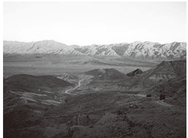
アラバ砂漠の典型的な風景