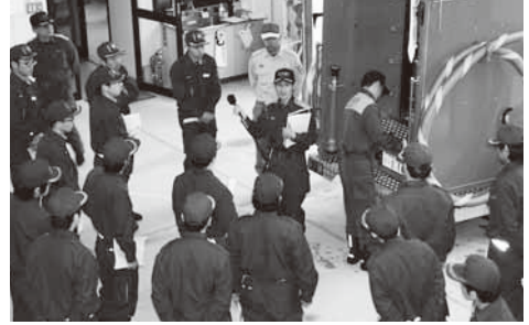
消防署員から指導を受ける新入団員ら

3月30日、八百津小学校校庭で、長年消防団員として活躍されたみなさんや、新たに入団される団員のみなさん約120人が出席して、八百津町消防団の入退団式および幹部講習会が開催されました。講習会では、新入団員が消防団員としての心得などの説明を受けた後、可茂消防八百津出張所の職員から整列等の基礎、消防機械や器具の取扱い方法を学びました。