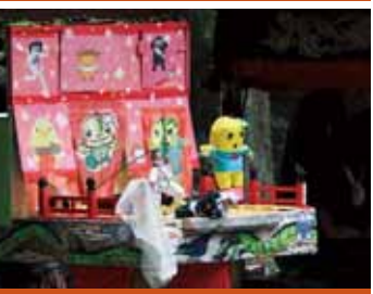
小草「牛若ジョーク」