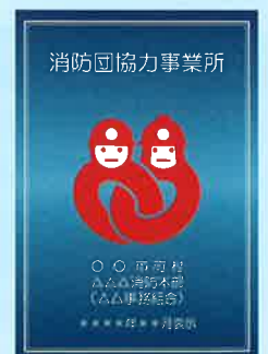
消防団協力事業所表示証

http://www.fdma.go.jp/syobodan/welcome/company/index.html