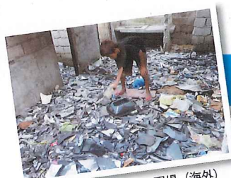
※廃家電の不適正処理の現場（海外） 有害物質が環境中に放出。