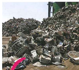
左：エアコンの室外機が 目立つ廃家電スクラップ の山。

廃家電が積み重ねられたスクラップの山は、電 池やプラスチックを含むため発火・延焼の危険 性が高く、業者の敷地や輸出港で大きな火災が 頻発しています。消火費用は私たちの税金から 支出されます。