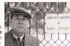
「ユダヤ人入るべからず」と書かれた看板の前で。(1939)

リトアニア・カウナスに、日本領事館開設を命じられた千畝は、同時にソ連からの情報を集めることを命ぜられます。戦争の激しくなったこの頃、ヒトラーによるユダヤ人迫害も激しさを増し、彼らの受け入れ先はほとんど無くなってしまいました。