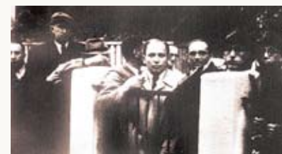
領事館前でビザを求めるユダヤ避難民たち。(1940)

そして1940年、千畝にある決断を迫られる出来事が起こります。ナチの目を盗んで逃げてきたユダヤ人たちが、ヨーロッパから逃れるために、日本への通過ビザを求め、領事館前におしかけたのです。