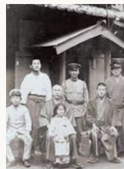
杉原一家(後列中央が千畝)

1900年、千畝はごく一般の環境と家庭の中で生まれ育ちました。英語教師となる夢を目指し勉学に励みますが生活が苦しくなり、公費で勉強ができる外交官留学生試験に、猛勉強の末合格しました。そしてロシア語研修生として、人生の方向転換をしたのです。