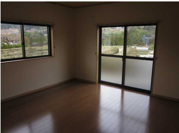
洋室2 ※ 照明入居者持込