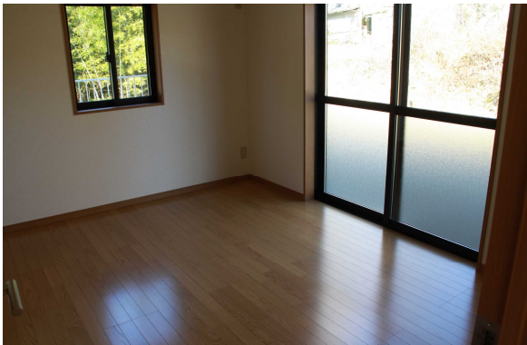
洋室2 ※ 照明入居者持込