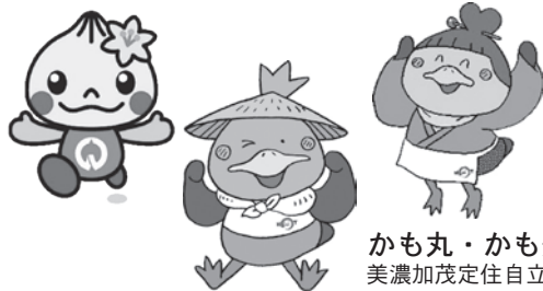
かも丸・かも美 美濃加茂定住自立圏 マスコットキャラクター