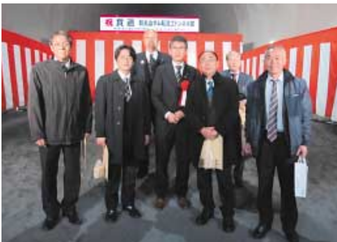
新丸山ダム転流工トンネル部貫通報告会 (1/26)