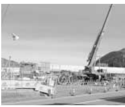
八百津排水路整備工事現場

次期工事につきましては、「西友」前から旧中央公民館までの約210mの推進工事を、平成31・32年度で施工する予定で、大仙寺までの工事は、平成33年度以降を予定しております。