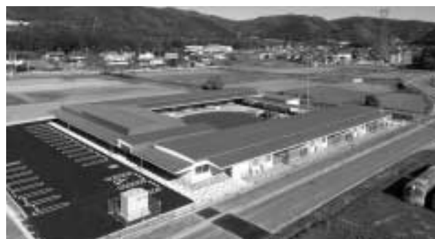
錦津保育園 新園舎