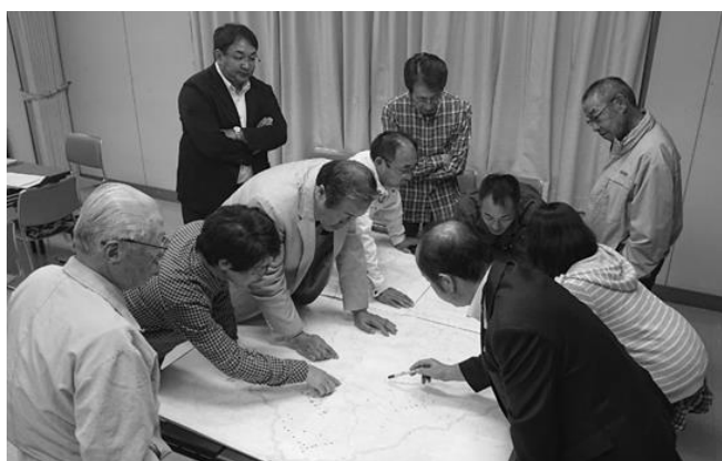
運行エリア、バス停位置の確認(久田見協議会)