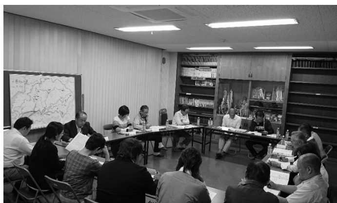
運行方法に関する協議(潮南協議会)