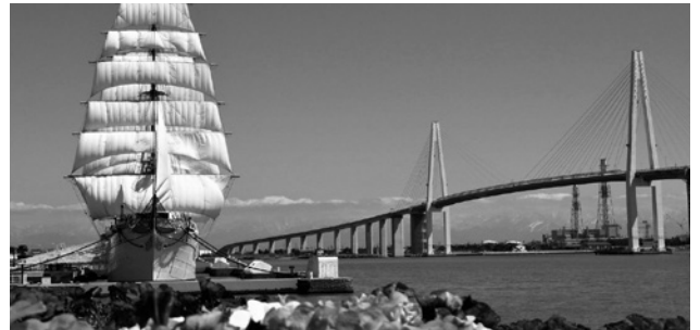
富山湾と新湊大橋(海王丸パーク)

富山県と岐阜県は、連携してお互いの県の魅力をPRしています。両県で企画した、周遊エリア内の高速道路が定額で乗り放題となる割引企画を利用して、魅力満載の富山をドライブしませんか。