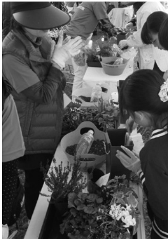
寄せ植え体験教室の様子

色鮮やかなフラワーアレンジメント作品の展示や県内で生産された花の品評会、誰でも参加できる寄せ植え体験教室などを開催します。また、当日の花フェスタではオータムガーデンショー「ハロウィンガーデン」も開催しています。色とりどりの花に囲まれた一日をお過ごしください。