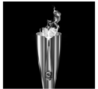
聖火リレートーチ

2日間にわたって、県内11市町で県ゆかりの聖火ランナー164人がオリンピックの聖火をつなぎます。各市町の出発地や到着地では、セレモニーも実施されます。当日は、会場や沿道で聖火ランナーへの温かい声援をお願いします。