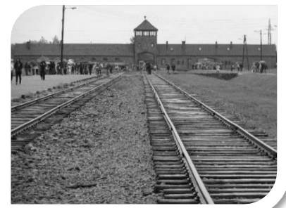
ポーランド アウシュヴィッツ