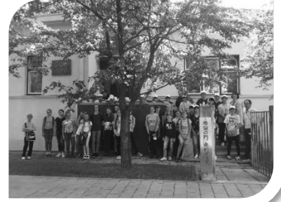
カウナス 杉原ハウス