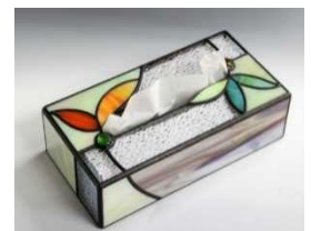
ティッシュボックス